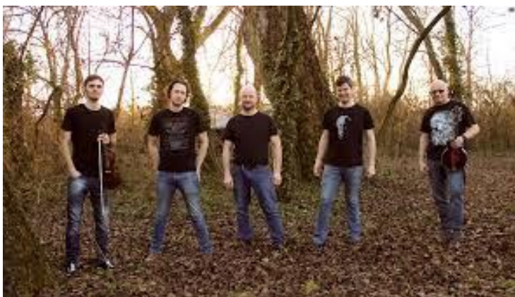
G-Runs ,n Roses