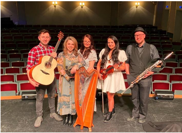
3 on the bund

Rasch haben sie einen Sound gefunden, der frisch und voller neuer Ideen steckt.