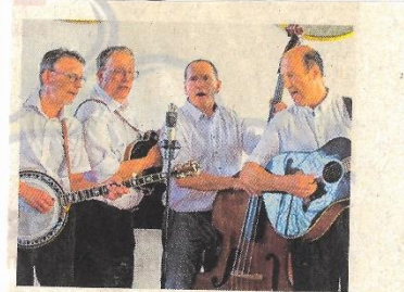
Die international berühmte Bluegrass-Band Sacred Sounds of Blue begeisterte die zahlreichen Zuhörer im Kaisersaal in Wettenhausen.