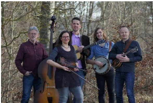
Bunch of Grass

Am Freitag, den 8. September eröffnet die süddeutsche Formation „BUNCH of GRASS“ um 19.30 Uhr das Festival. Das Band-Repertoire besteht aus Standards, neuen Bluegrass-Nummern und eigenen Kompositionen. Voller Energie bringt das Quintett Tempo, originelle Soli, gefühlvolle Klänge und den typischen Harmoniegesang auf die Bühne. Die Formation „BLUEGRASS CASH“ wurde vom Holländer Martin Voogd in Köln gegründet. Die Inspiration für seine Johnny Cash Tribute Band im Bluegrass Stil fand er auf dem Cologne Bluegrass Bash, den er regelmäßig in Köln besucht. Voogd sagt: „Ich würde unseren Sound als einen einzigartigen neuen Ansatz beschreiben, der auf dem berühmten ‚Boom-Chicka-Boom-Sound‘ von Johnny Cash basiert, mit Einflüssen, die tief im Bluegrass verankert sind.“