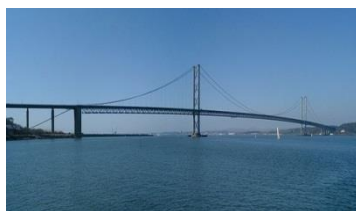
Forth Road Bridge