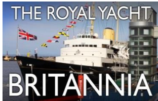
The Royal Yacht Britannia

4. Tag : Am heutigen Tag fahren Sie von Edinburgh via Pitlochry nach Inverness. Die schottische Hauptstadt verlassen Sie in Norden immer über eine Brücke. Mit dem Auto überqueren Sie die Forth Road Bridge oder die Queensferry Crossing, mit dem Zug ist es die Firth of Forth Bridge. Für einen Fotostopp sind alle Brücken ein ideales Motiv.