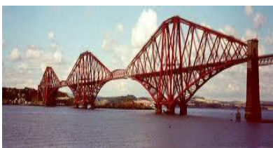
Firth of Forth Bridge

4. Tag : Am heutigen Tag fahren Sie von Edinburgh via Pitlochry nach Inverness. Die schottische Hauptstadt verlassen Sie in Norden immer über eine Brücke. Mit dem Auto überqueren Sie die Forth Road Bridge oder die Queensferry Crossing, mit dem Zug ist es die Firth of Forth Bridge. Für einen Fotostopp sind alle Brücken ein ideales Motiv.