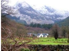
Fort William area

Durch die Nähe zum Ben Nevis, dem höchsten Berg Großbritanniens, ist Fort William eine quirlige Stadt mit Einkaufsstraße, kleinen Läden, aber auch den unterschiedlichsten Pubs.