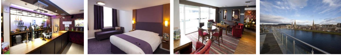
3* Hotel Inverness