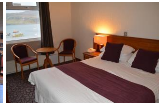
3* Hotel Portree

Lassen Sie sich nach dem Dinner im Hotel von der besonderen Atmosphäre Portree's anstecken.