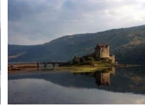
Eilean Donan Castle

Eilean Donan - eine wahre schottische Ikone. Ihr Bild erkennt man überall auf der Welt. Es wundert kaum, dass die Burg, gelegen auf einer Insel am Schnittpunkt dreier Meerbusen und umgeben von majestätischer Landschaft, heute eine der am meisten besuchten der schottischen Highlands ist.